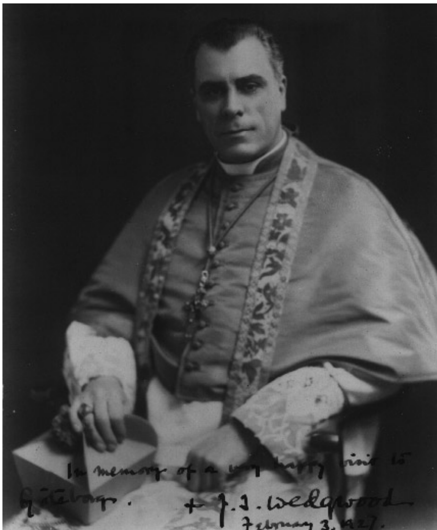
I februari 1927 hade Göteborg besök av bisop James I. Wedggewood. På ovanstående foto har han skrivit: In memory of a happy visit to Göteborg. J. I. Wedgewood Februari 3, 1927.

Det är synd att människor, som diskuterar religiösa frågor, så ofta inte gör sig besvär att underkasta dem samma noggranna och allsidiga studium, som de ägnar andra områden inom vetenskapen. När det gäller andra vetenskaper, accepterar man, att man måste studera och träna för att behärska dem. Men när det gäller religionen - vetenskapen de yttersta och högsta tingen - anser sig vem som helst kompetent att uttala sig utan föregående forskning. I stället för att undersöka det väldiga material, som faktiskt finns, tycks de flesta när det gäller religion tro att det bara är en fråga om hur man "känner". Och så låter man