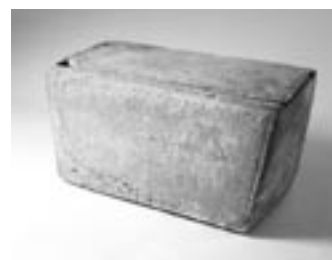
Det benskrin som enligt inskriptionen tillhör "Jakob, Son till Josef, broder till Jesus"