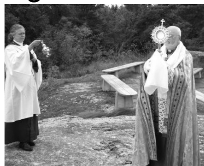
Sakramental Välsignelseandakt på Capella.