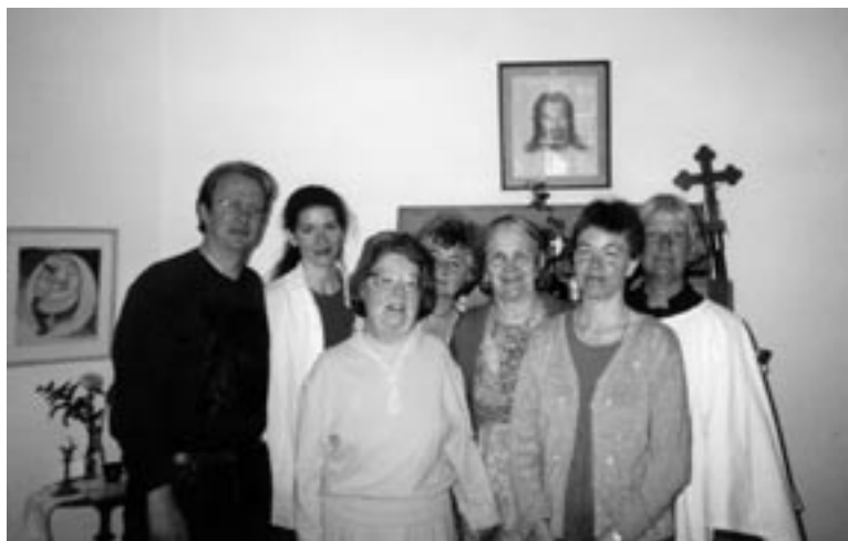
Några församlingsmedlemmar framför altaret