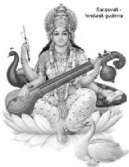
Tvärtom pekar den feministiska

Sanningen tycks dock tyvärr ligga långt ifrån en så här positiv idé om hur våra förfäder (och nutida utövare, i alla fall inom hinduismen m.fl. religioner med gudinnekulter) uppfattade kvinnans värde.