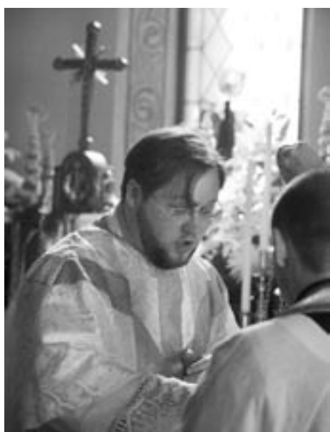
060423-Första Mässan - Må Du välsignas ...