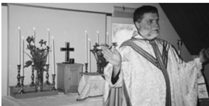
060528-Första Mässan - Herren vare med er