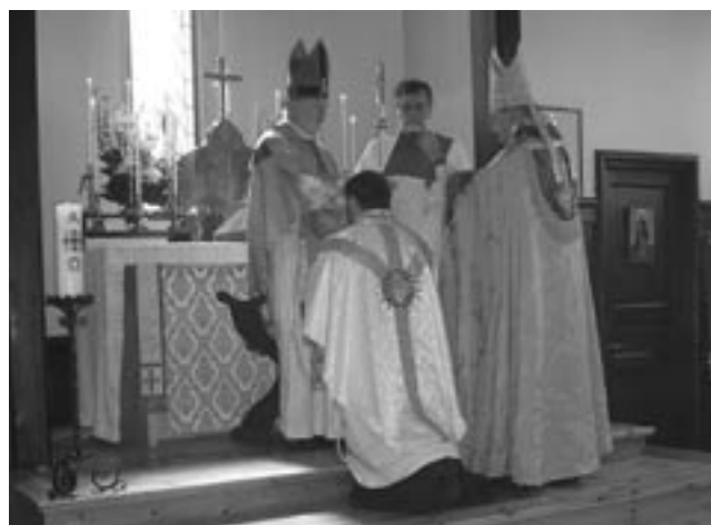
060422-Prästvigning - O Gud all helighets källa ...