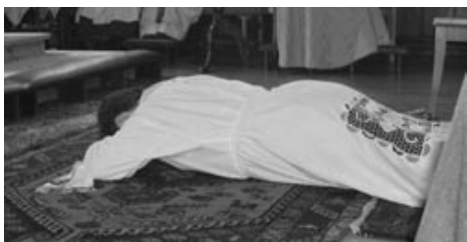
060422-Prästvigning - Fader bortom rum och tid ...