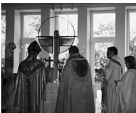
060527-Konsekration av prästkors