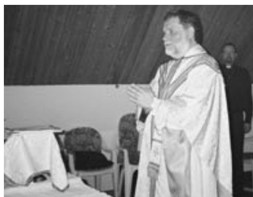
060528-Första mässan - Communio