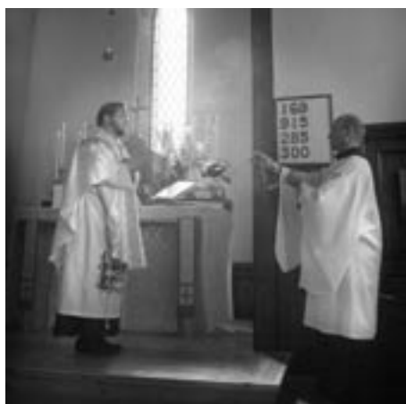
060423-Första Mässan - Beräkning