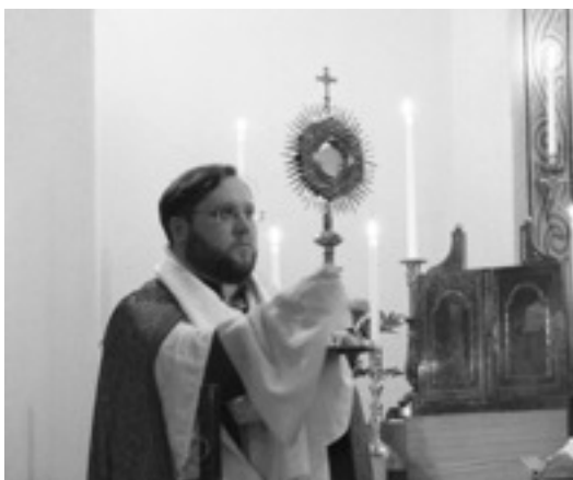
Påskdagen - Völsignelseandakt