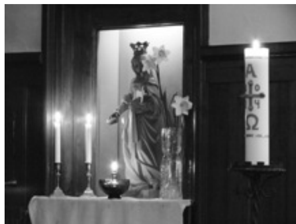
Mariaaltaret och Påskljuset