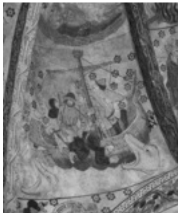
Jona och valfiskens