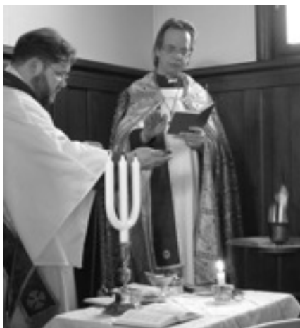
Påskafton - Eldens Völsignande