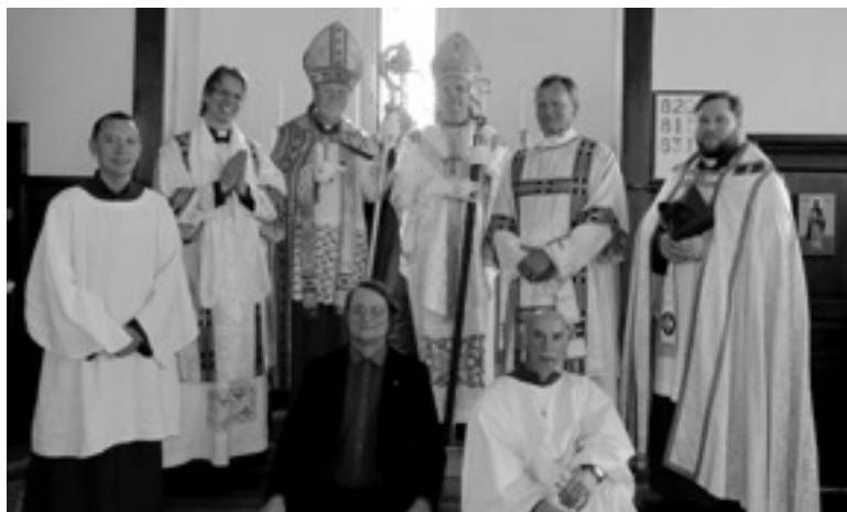
Deltagare i koret och vid orgeln