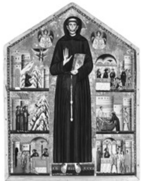
Franciskus med scener ur hans liv

År 2013 valdes en ny påve som tog namnet Franciskus. Han var som en frisk fläkt och blev enormt populär. Han gick ut bland folk och pratade med s k "vanligt folk" på gator och torg och han åkte i en vanlig bil när han skulle ut utanför Rom. Bara detta var för alla en alldeles fantastisk sak. Han åkte inte i den skottsäkra "bilen" som påvarna före honom hade åkt i. Den här påven mötte folk och talade med dem. För min del tänker jag alltid på den helige Franciskus av Assisi när jag läser om honom eller ser honom på TV och jag brukar säga till min dotter att med