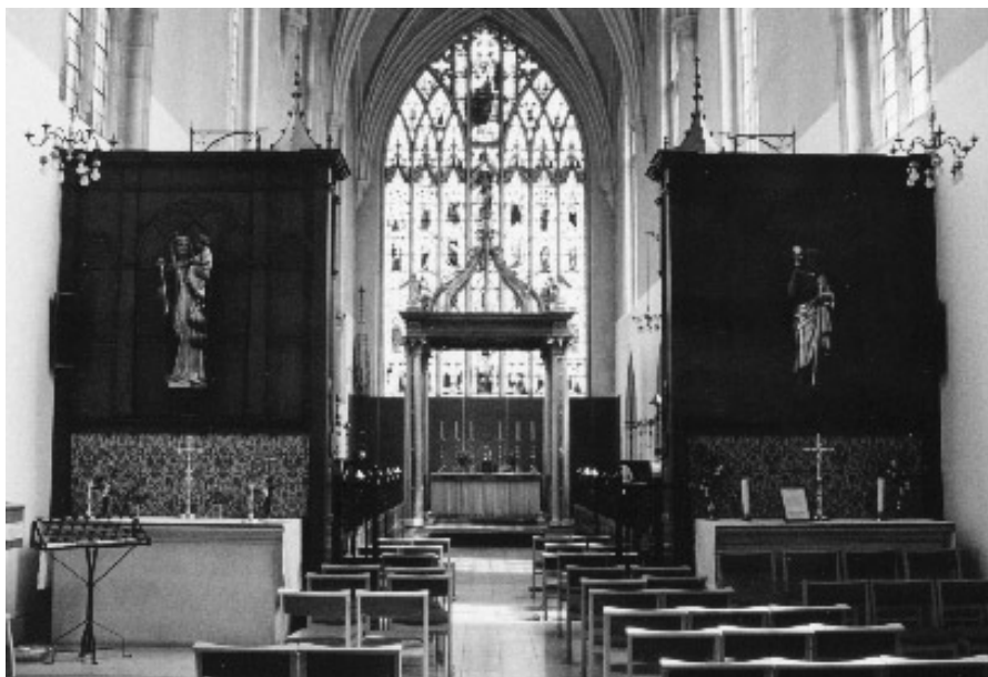
Kyrkan i All Saints Pastoral Centre med dess vackra altare och sidoaltaren för Maria och S:t Alban

Biskoparna hade ett digert program med en agenda innehållande 90 motioner samt några vid synoden väckta förslag. Trots det gavs det tid att tillsammans med deltagarna i ICS och kyrkokongressen att göra en utflykt till det närbelägna S:t Albans Cathedral för att med bl. a. dess tillstånd att lägga blommor vid S:t Albans gravplats vilken är belägen i ett kapell inne i katedralen.