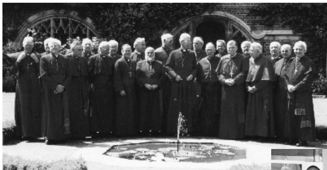
T. v. Biskoparna samlade för fotografering på inngården i All Saints Pastoral Centre.