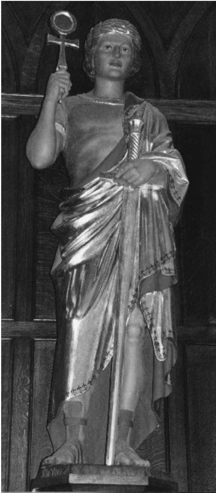
S:t Alban på sidoaltaret i kyrkan i All Saints Pastoral Centre, London Colney