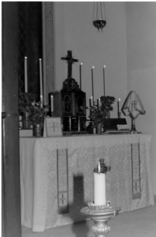
Altaret i S:t Mikael's och Alla Änglars kyrka före vigilian.

På altaret stod monstransen framme med Sakramentet (en stor oblat) exponerad, och alla ljus både på altaret och i resten av kyrksalen brann oavbrutet hela natten. Böneböcker och litteratur om helgonen fanns tillgängliga för den som ville söka stöd i sin bön.