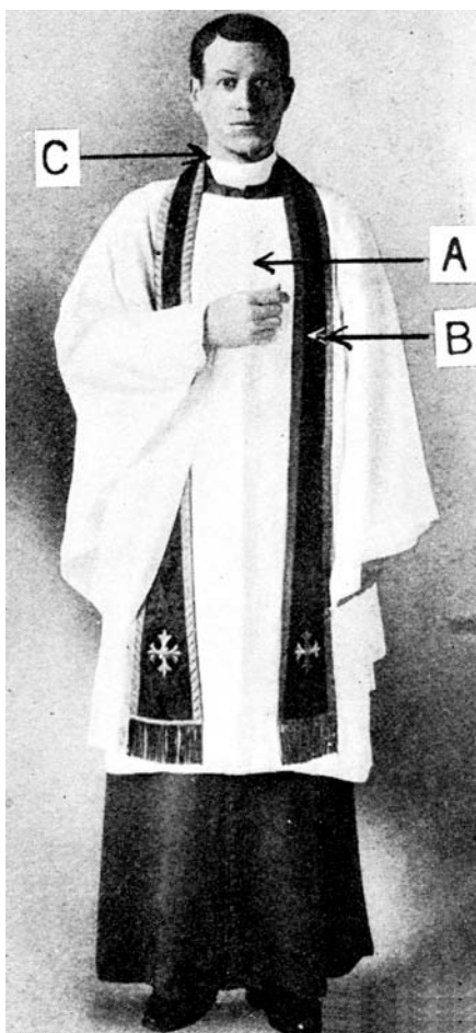
A = Surplice

I strikt mening skall surplicet enbart bäras av prästerkskapet och de som mottagit ordination till ordines minores 2 men vanligtvis används det även av de som tjänstgör som altartjänare utan sådan ordination.