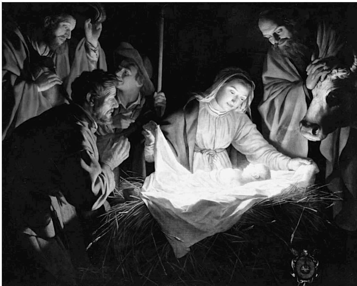
Jesu födelse, målning av den nederländske konstnären Gerrit van Honthorst

Vid den tiden utfärdade kejsar Augustus en förordning om att hela världen skulle skattskrivnas. Det var den första skattskrivningen, och den hölls när Quirinius var ståthållare i Syrien. Alla gick då för att skattskrivna sig, var och en till sin stad. Och Josef som genom sin härkomst hörde till Davids hus, begav sig från Nasaret i Galileen upp till Judeen, till Davids stad Betlehem, för att skattskrivna sig tillsammans Maria, sin trolovade, som väntade sitt barn.