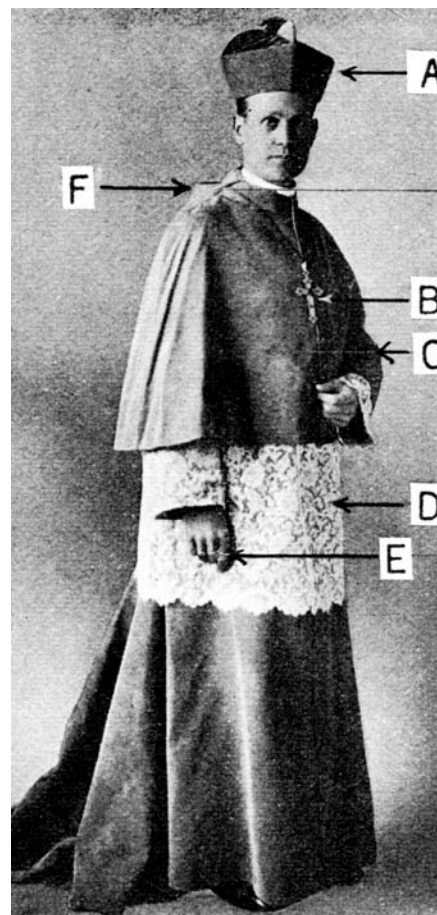
D = Rochetta

Den är till sin utformning en slags variant av cottan men har betydligt bredare spets. Spetsen är ofta mer än 40 cm bred och ofta mycket kostbar. Plaggets armar som likt albans är raka och inte särskilt vida har breda spetsmanschetter och når ner till handlederna. Plagget är normalt så långt att fällen slutar strax ovanför eller i höjd med knäna. Spetsen vid manschetterna är fodrad med eldrött silkestyg. Rochettan används av biskopar istället för surplice. Inte heller detta plagg bärs med någon form av gördel knuten runt livet. Rochettan bärs aldrig utan något plagg som täcker det åt mindstående delvis.