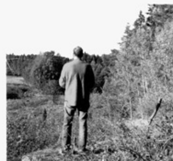
DU ÄR FJARRSKADAREN