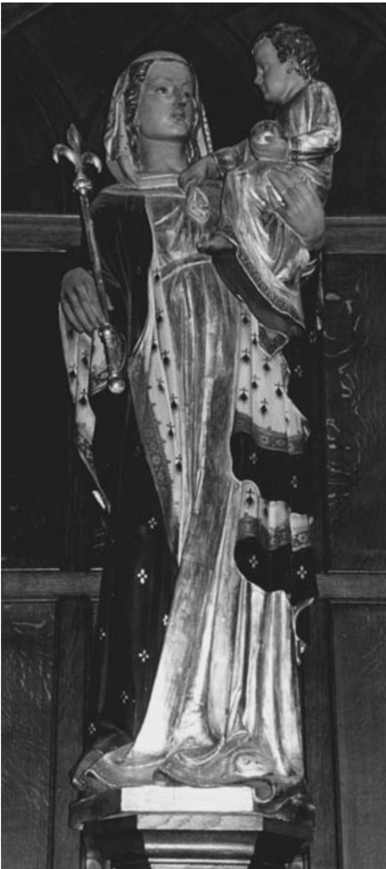
Lady Mary på sidoaltaret i kyrkan i ALL Saints Pastoral Centre, London Colney