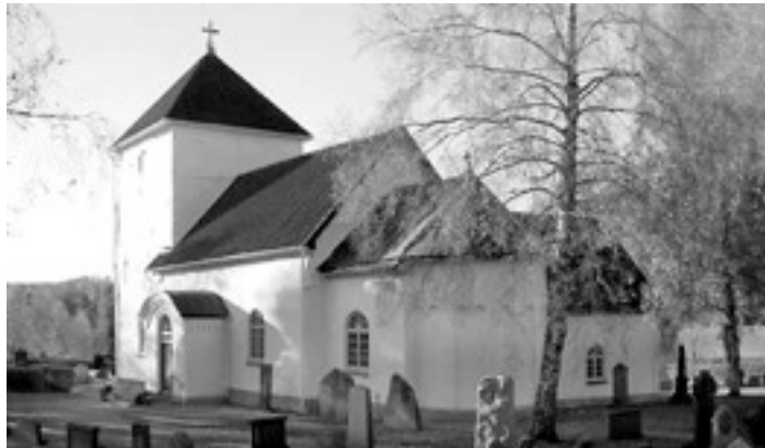
Dalums absidkyrka från 1100-talet

De äldsta delarna av Dalums kyrka söder om Blidsberg är långhuset, koret och absiden vilka på 1100-talet uppfördes av sandsten i romansk stil. Absiden anses visa prov på inflytande från Lunds domkyrka.