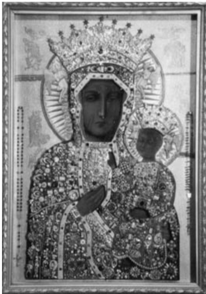
Den Svarta Madonnan i Czectochowa

Om det också finns kopplingar till kulten kring den svarta Kali i Indien, och om de bägge har sitt ursprung hos den svarta befolkningen i Lemurien, återstår för framtida upptäckter att visa.