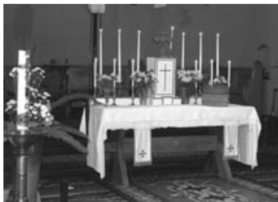
I konferenscentrets kyrka arrangerades LKK-altaret.