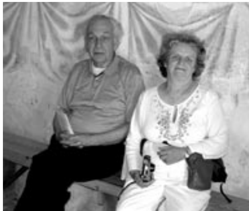
Biskopsparet besökte Härkeberga kyrka