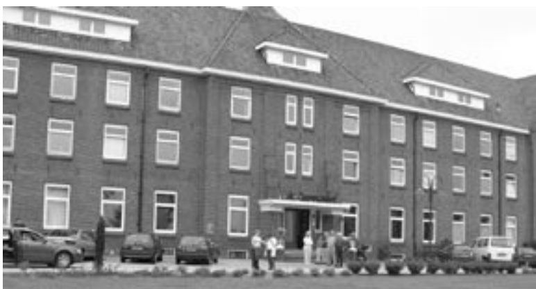
”Den Zwanenhof” är en stor konferensanläggning med park och naturligtvis en damm med svanar.