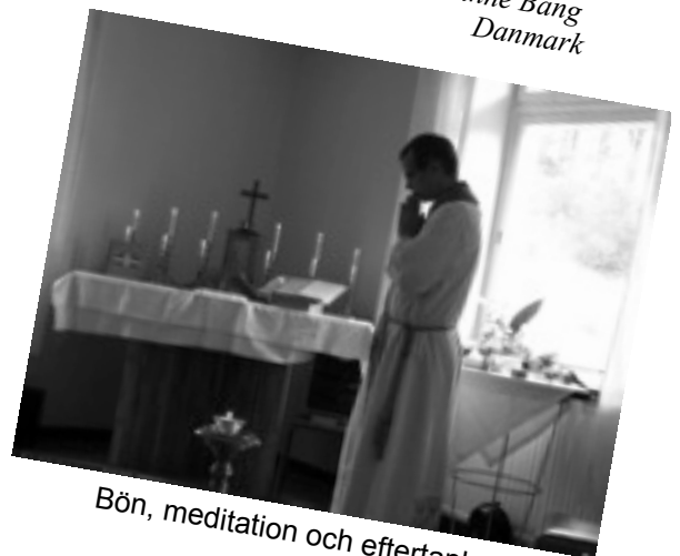
Bön, meditation och eftertanke