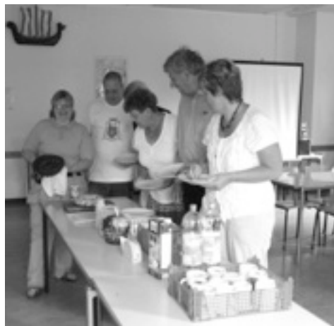
Middag (lekamlig spis)