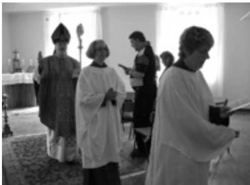
Gudstjänster (andlig spis)

Takk! för en sommarsamling som jag aldrig ska glömma. Det var så bra, det var så intenst, så mycket att uppleva! Jag kom till Sommarsamling i Heds Skola med förväntan att få träna flera sorts mässor och tjänster. Det fick jag! og mer till ... Jag fick goda vänner och många goda "snakke". Och jag fick hjälp til lugnet, balansen, friden inom mig. Takk! for goda dagar